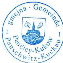
Markus Kreuz Bürgermeister

Gegen diese Verfügung kann innerhalb eines Monats nach Bekanntgabe Widerspruch erhoben werden. Der Widerspruch ist schriftlich oder zur Niederschrift beim Verwaltungsverband „Am Klosterwasser“, Poststraße 8, 01920 Panschwitz-Kuckau oder bei der Gemeinde Panschwitz-Kuckau, Poststraße 8, 01920 Panschwitz-Kuckau einzulegen. Die elektronische Kommunikation ist beschränkt auf einfache Anfragen und Terminabsprachen.